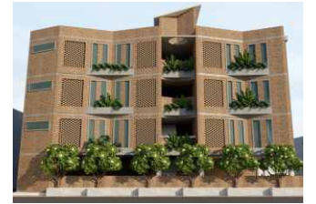
बिल्डिंग का प्रस्तावित स्वरूप

प्लॉट नं: सी-49, राम विहार कॉलोनी, ग्राम लोनी, नियर तारा नेत्रालय, चिरोड़ी रोड, लोनी, गाजियाबाद 201102 (यूपी.)