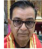
श्री राम होजरी सोनीपत ( हरि. )