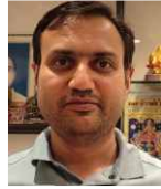
आनन्द ज्वेल्स एवं डायमण्ड बैंगलोर