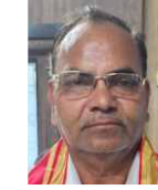
जैन माहक्रोन इंडस्ट्रीज