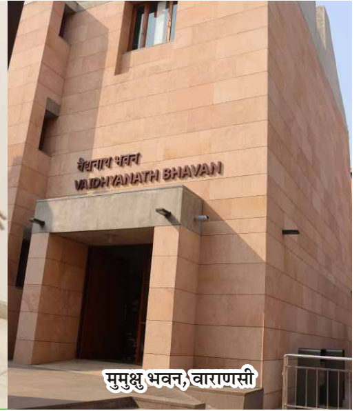
मुमुक्षु भवन, वाराणसी