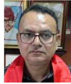
मीनाक्षी इलेक्ट्रिकल्स बैंगलोर