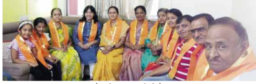
जैन सोशल ग्रुप संगिनी मैन उदयपुर